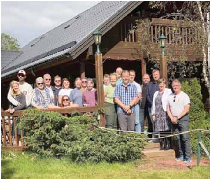
Myndin var tekin þegar samningur um kaup á hóteleiningunni var staðfestur.