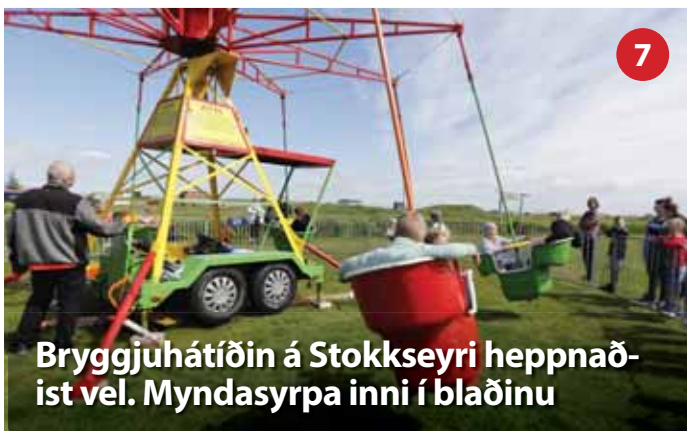
Bryggjuháttíðin á Stokkseyri heppnað-ist vel. Myndasyrpa inni í blaðinu

Heilsustofnunar og heilsudvalarstaðar. Umferðartengingar og bílastæði eru vel leyst og á austur-vestur-ási liggur sameiginlegur inngangur að Heilsustofnun og heilsudvalarstað. Aðalinngangurinn er vel heppnaður með góðar tengingar bæði við meðferðarkjarna, sundlaug og heilsulind. Beint útsýni að Varmá og meðferðargörðum gefur strax rétta tóninn. Tveggja hæða byggingarnar falla vel að umhverfinu jafnframt því að þetta byggðina og stytta vegalengdir.“ Vinnings-tillagan hlaut 4,5 milljónir í verðlaun. -gpp