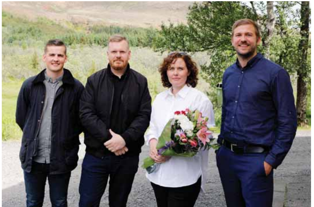
Vinningshafarnir frá Arkþing-Nordic og Eflu.

Félagið Stök gulrót ehf. hefur fest kaup á 40 herbergja hóteleiningu með góðri þvotta- og starfsmannaaðstöðu frá Moelven í Noregi. Húsið verður reist í Fagralundi þar sem fyrir er lítið gistihús. Lóðin er í Reykholti í Biskupstungum, á besta stað við Gullna hringinn. Áætlað er að hótelið verði opnað um miðjan júní 2021. „Fjölgun gistirýma á svæðinu er til þess fallin að styðja við aðra ferðatengda þjónustu og auka möguleika á að ferðamenn eyði lengri tíma í Bláskógabyggð,“ segir í tilkynningu frá sveitarfélaginu Bláskógarbyggð. -gpp