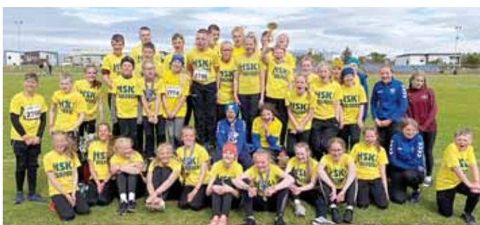
Sigursveit HSK/Selfoss að loknu góðu móti á Sauðárkróki