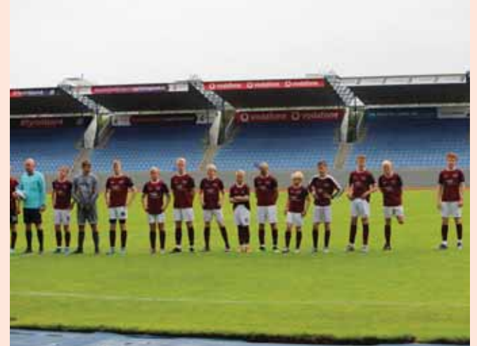
Strákarnir í 4. flokki léku til úrslita í keppni A-liða en urðu að láta í minni pokann gegn öflugum Víkingum frá Reykjavík.

lið í 4. flokki á mótinu og gekk þeim heilt yfir vel. Miklar framfarir voru hjá öllum liðum bæði í sigrum og ósigrum.