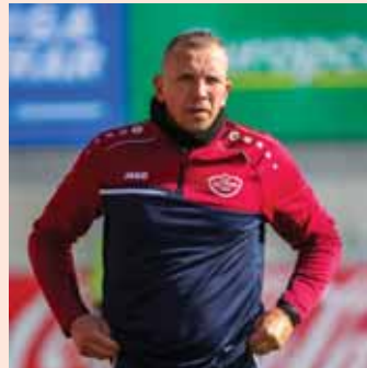
Selfyssingar þurfa að hysja upp um sig buxurnar fyrir næsta leik.