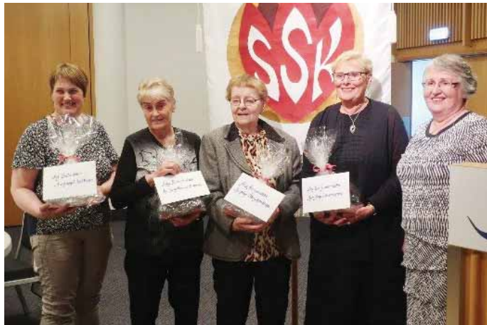
Prjónakonurnar sem fengu viðurkenningu ásamt formanni SSK.

Á fundinum var tilkynnt um val á Kvenfélagskonu ársins 2019. Stjórnir kvenfélaganna velja konur úr sínum félögum til þessarar viðurkenningar.