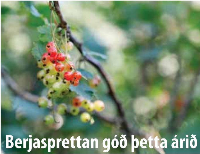
Berjasprettan góð þetta árið

Það er fleira en gullregnið sem nýtur góðs af góðu árferði, en útlit er fyrir að berjasprettan verði með allra besta móti þetta árið. Það hafa borist af því fregnir að víða sé krökkt af krækiberjum, bláberjum og aðalbláberjum. Þá má ekki gleyma lystisemd náttúrunnar; villtu jarðarberjunum sem stundum leynist hér og hvar. Hvað sem því líður þá eru rifsberjarunnarnir og sólberjarunnarnir margir farnir að sligast undan ljúffengum berjunum sem bíða þess eins að verða tínd og nýtt til matar. Hér eru rifsíð ögn farið að roðna og senn styttist í uppskeru. -gpp